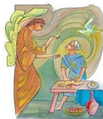
carmel St Joseph