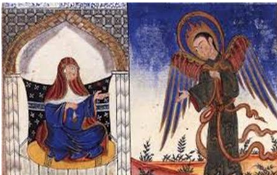
L'art du livre arabe